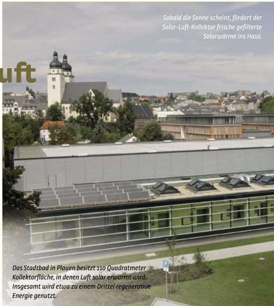
Sobald die Sonne scheint, fördert der Solar-Luft-Kollektor frische gefilterte Solarwärme ins Haus.

Die eindrucksvollen Energieeinsparungen für die Turnhallen des Münchener Gymnasiums zeigen sich in einer Langzeitstudie.