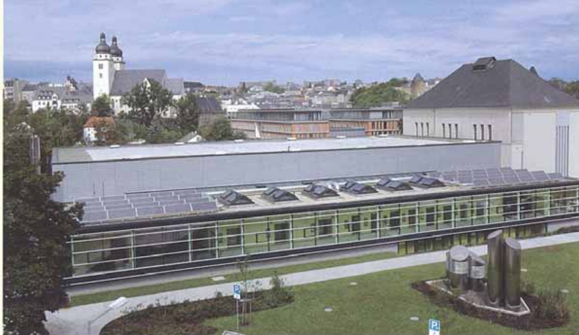
Der Turnhallenkomplex des Münchener Karlsgymnasiums trägt 190 m 2 Kollektorfläche, in denen Luft solar erwärmt wird.