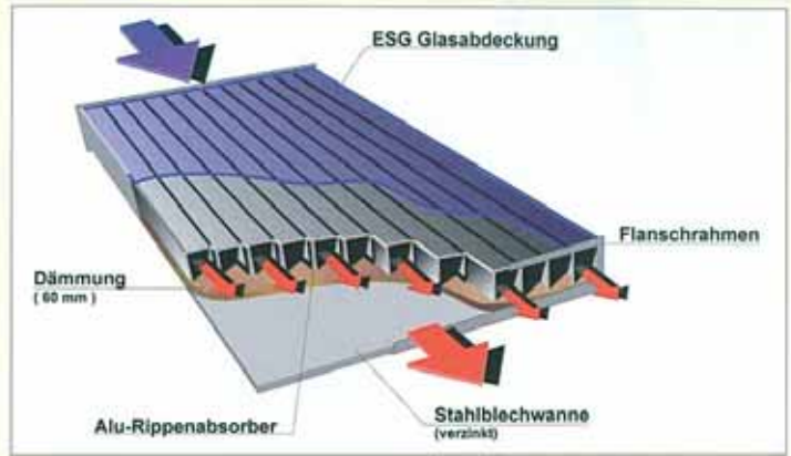
Kollektorschnitt: Zwischen Aluminiumabsorber und 4 mm-ESG wird die Warmluft gebildet. (Darstellung: Graphik Haussystem, BSO)

das Gebäude jetzt zu 32 % mit ökologisch erzeugter Energie versorgt.