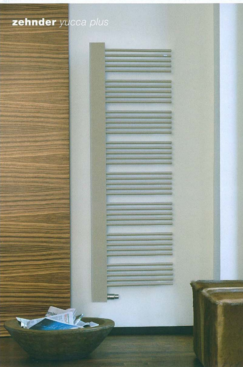
zehnder yucca plus